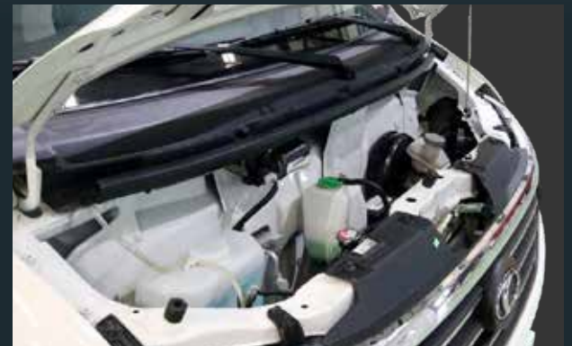
Nắp capo phía trước dễ dàng bảo dưỡng hằng ngày