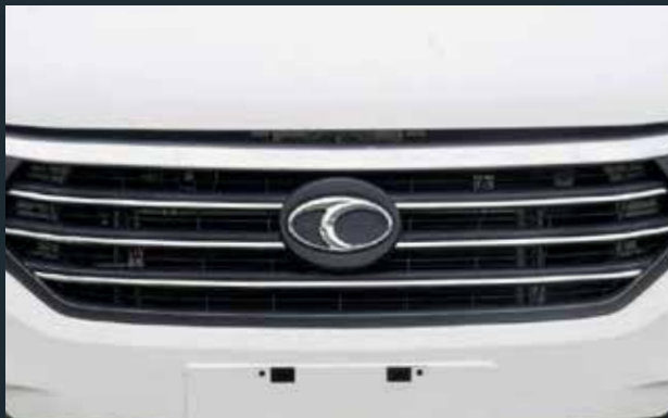
Hệ thống lưới tản nhiệt đa tầng với đường viền mạ Chrome sáng bóng