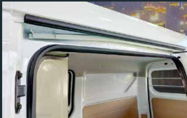
Ray và roang cửa lùa thiết kế phù hợp, đảm bảo độ kín khít cửa cửa không bị